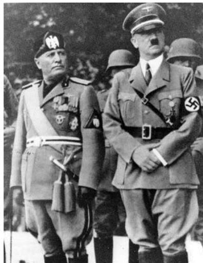
Drugom svetskom ratu kao suprotnost savezničkim silama.

TROJNI PAKT (poznat i kao Pakt tri sile, Osovinski pakt, Pakt tri pravca ili Trojna pretnja). Pakt koji je potpisan u Berlinu, Nemačka, 27. septembra 1940. godine. Potpisali su ga Saburo Kursu iz carevine Japan, Adolf Hitler iz nacističke Nemačke i Galecio Đano (ministar inostranih dela) iz fašističke Italije. Time je zvanično stvoren vojni savez sila Osovine u